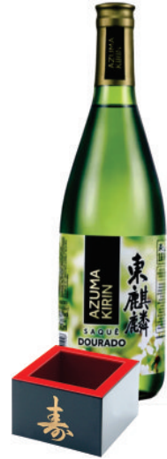
SAQUÊ AZUMA KIRIN