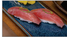
DUPLA NIGUIRI DE ATUM