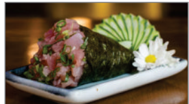
TEMAKI DE ATUM